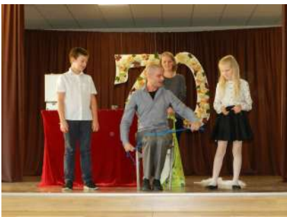
Pasākums 1.-4.kl. „Mazās raganiņas skola”

Laika skrējienā ir pieturas – mirkļi, kas ieskanas drošāk, mirkļi, ko ieraksta košāk lielajā vēstures grāmatā. Tāds mirklis bija arī oktobrī - Brocēnu vidusskolas 70 gadu jubileja.