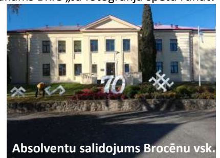
Absolventu salidojums Brocēnu vsk.