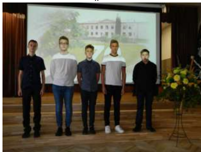
Pasākums 9.-12.kl. „Manai skolai 70!”