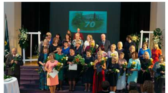
Pasākums BKIC „Ja fotogrāfija spētu runāt!”