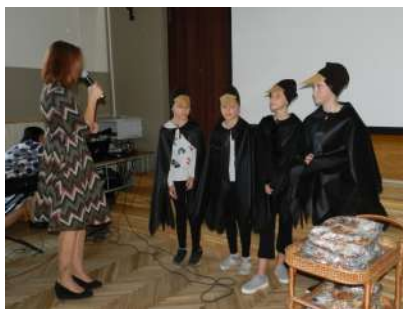
Pasākums 5.-8.kl. „Putni salido”