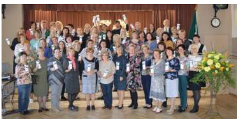
Pasākums skolotājiem „Paldies, SKOLOTĀJ!”