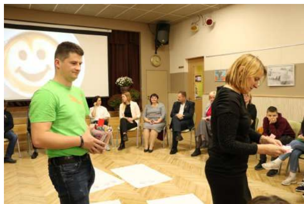
Pasākumā „Kafija ar politiķiem” 2019.gada 13. novembrī.